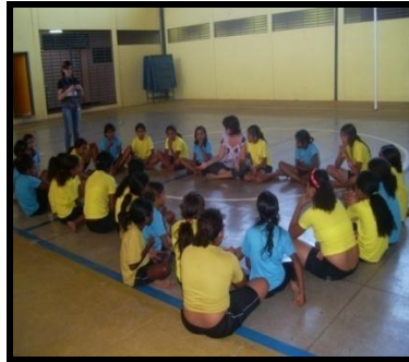
Imagem 2. Explicando e sensibilizando as crianças para a pesquisa