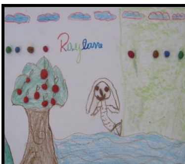
Imagem 7. Corpo Sereia