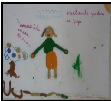
Imagem 13. Corpo Poder de Fogo