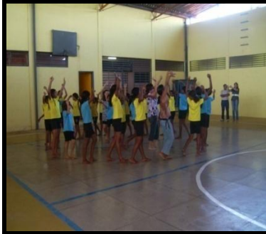
Imagem 4. Brincadeiras