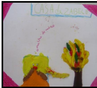
Imagem 11. Corpo Mulher da Cobra