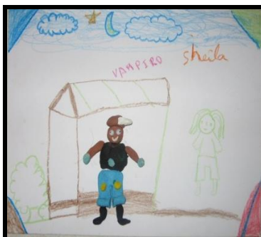
Imagem 16. Corpo Mutante Vampiro