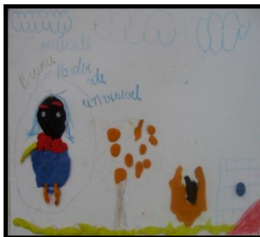
Imagem 14. Corpo Invisível