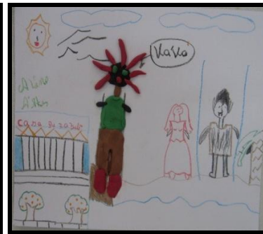
Imagem 12. Corpo Vavá