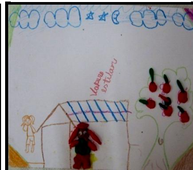
Imagem 17. Corpo Vampira Estelani