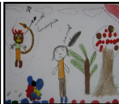
Imagem 15. Corpo Escorpião