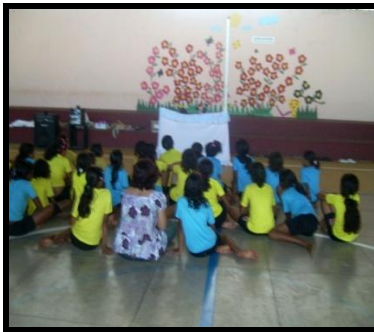
Imagem 1. Acolhida com o uso de fantoches